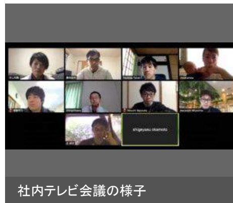
社内テレビ会議の様子